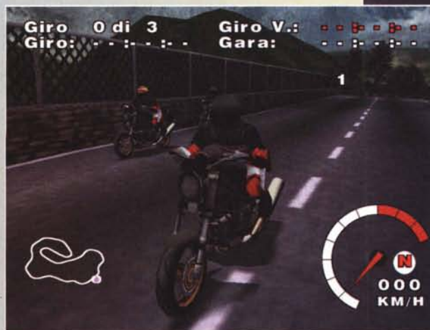
Le moto sono abbastanza curate nei particolari, mentre le ombre sembrano alquanto anonime.

pieni voti diverse prove di guida, in modo da abilitare le meritate patenti, divise in quattro categorie principali. Le prime due metteranno alla prova i vostri riflessi con semplici circuiti e cilindrate minori, mentre quelle complete ed avanzate stroncheranno anche coloro che possiedono dei riflessi da androide, dato che la velocità cui sarete sottoposti sarà pressoché impressionante. Comunque, un bravo pilota sarà ricompensato con ingenti somme in denaro: questa meritata vincita servirà per modificare il vostro bolide, come, ad esempio, cambiare il motore, i freni, la carenatura, i cerchi, la frizione o le gomme; inoltre, il "gruzzolo" consentirà anche l'acquisto di nuovi modelli, di nuove tute e di caschi personalizzati. Il vostro garage si potrà ampliare, non solo tramite le vincite nei vari campionati ma anche grazie a vere e proprie sfide dual-head; infatti, il sopravvissuto eliminerà l'avversario sottraendogli direttamente la moto, quindi attenzione... scegliete il possibile contendente solo quando sarete sicuri di vincere!