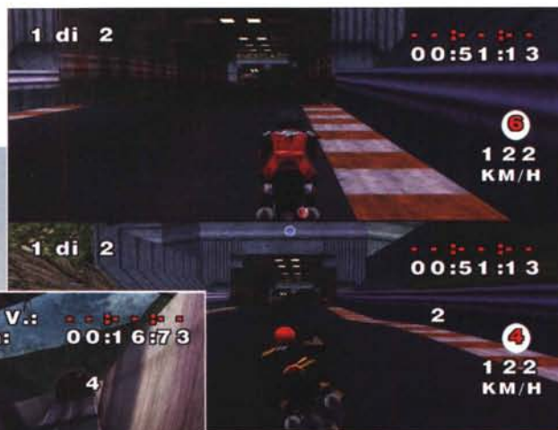
In alto, il ritorno dello split-screen per il gioco a due è sempre entusiasmante.

Se siete stanchi dei soliti simulatori motociclistici, dove si perdono interminabili ore per "settare" ogni singolo componente o dove bisogna trasformarsi in Max Biaggi solo per terminare un misero campionato, allora non posso che consigliarvi l'ultimo nato di mamma Acclaim. Questo tipico gioco di guida arcade unisce perfettamente una buona grafica ambientale ricca di particolari e la sensazione di guidare un vero siluro a due ruote, scegliendo tra una vasta gamma di modelli. Infatti, Ducati World vi trasformerà alla velocità della luce in un perfetto centauro capace di cavalcare le più prestigiose moto Ducati: dalla Daytona 350 degli anni Sessanta alla 750 Paso degli anni Ottanta, dalla moderna MH 900E e Superbike 996 allo stupendo Monster 900 Dark. Potrete dilettarvi in sfide all'ultima curva sia nella semplice corsa veloce e nella gara a tempo, sia nel complesso campionato diviso per categorie, oppure sfidare un vostro amico su un unico personal in modalità split-screen. Ovviamente, risultano particolarmente interessanti proprio le competizioni per categoria, dove il provetto pilota potrà scegliere: tra la sezione classica, con le divertenti ma raramente adrenaliniche gare dagli anni '50 agli '80; la versione moderna, con le gare dedicate solo ai monster, alle supersport e superbike, oppure impegnarvi nel campionato del SBK Challenge, della Formula 900 o del 750 Trophy. Per conquistare il podio, dovrete prima superare a