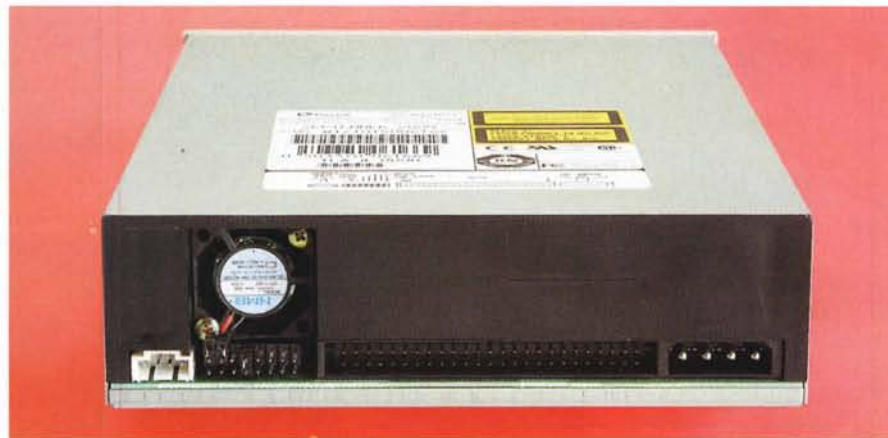
Sul retro del Plextor, oltre al consueto connettore SCSI, alle uscite audio e ai ponticelli per la scelta dell'indirizzo di periferica, troviamo una piccola ventola di raffreddamento.

l'intero contenuto del PC ospite con la solita visualizzazione ad albero. Sono presenti diversi strumenti come le informazioni relative al disco che sarà utilizzato e quelle sui masterizzatori disponibili. A richiesta è attivabile l'aiuto di un assistente in grado di seguirvi passo passo durante la preparazione della registrazione.