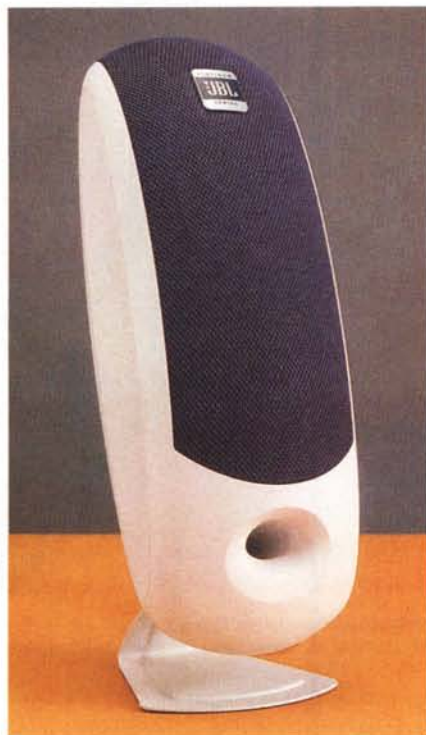
Assieme al computer viene fornita anche una coppia di altoparlanti che possono essere collocati sul piano della scrivania, montati sia su dei piccoli stand in metalli, sia sistemati ai lati del monitor.

ma ed è piena di tasti aggiuntivi. Ci sono tasti per facilitare il collegamento ad Internet, per l'avviamento del browser, per il controllo del lettore CD.