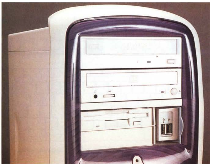
Sul pannello frontale troviamo, oltre al lettore DVD e al masterizzatore, anche due prese USB aggiuntive, molto utili e comode per il collegamento "al volo" di macchine fotografiche digitali e periferiche aggiuntive, di quelle che si usano una volta tanto.