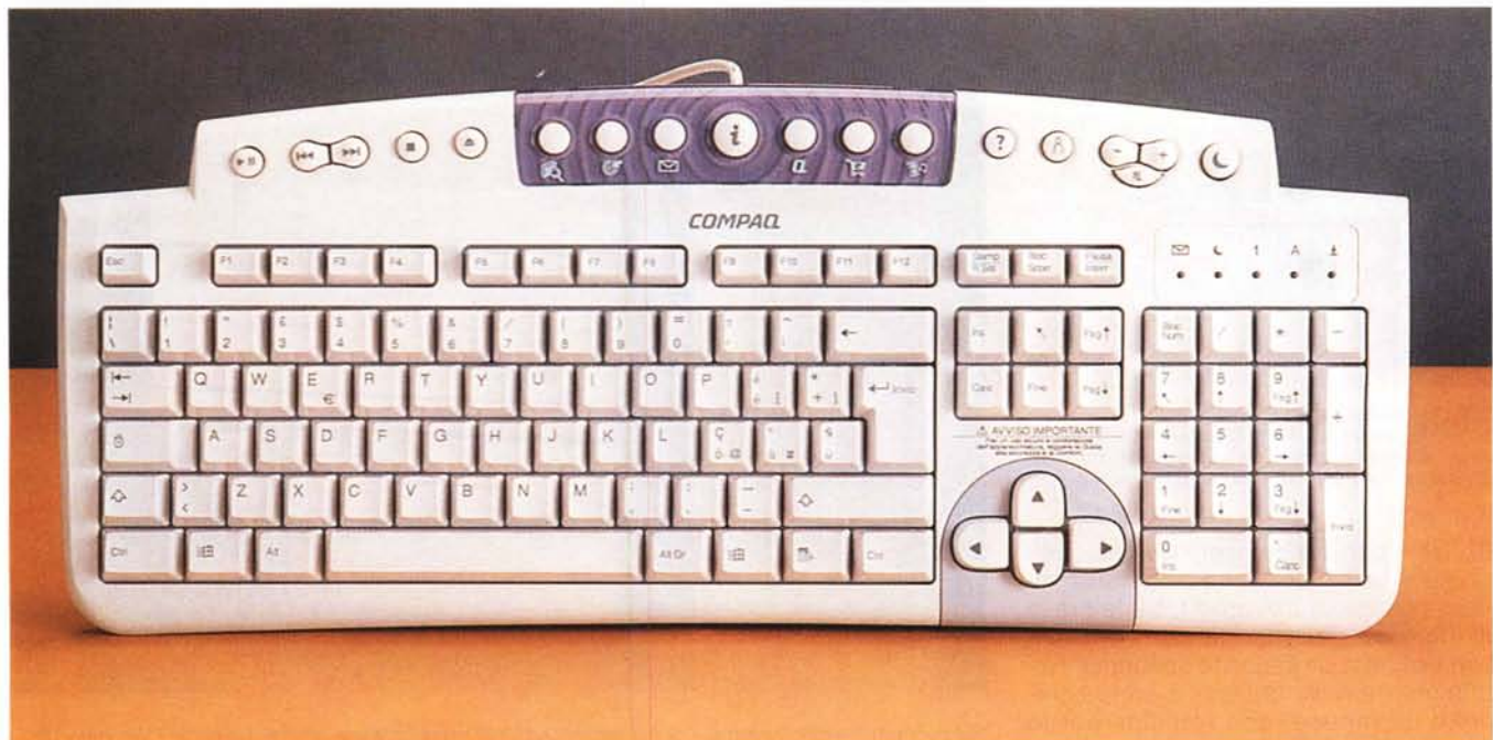
La tastiera è completissima e piena di tasti aggiuntivi. Ci sono tasti per facilitare il collegamento ad Internet, per l'avviamento del browser, per il controllo del lettore CD.

anni ormai non si vedono più, almeno per le applicazioni più comuni. Tale spazio è stato occupato dall'hard disk, che è montato verticalmente su un supporto ad hoc. Tornando all'esterno sul pannello frontale troviamo, oltre al lettore DVD, anche due prese USB aggiuntive, molto utili e comode per il collegamento "al volo" di macchine fotografiche