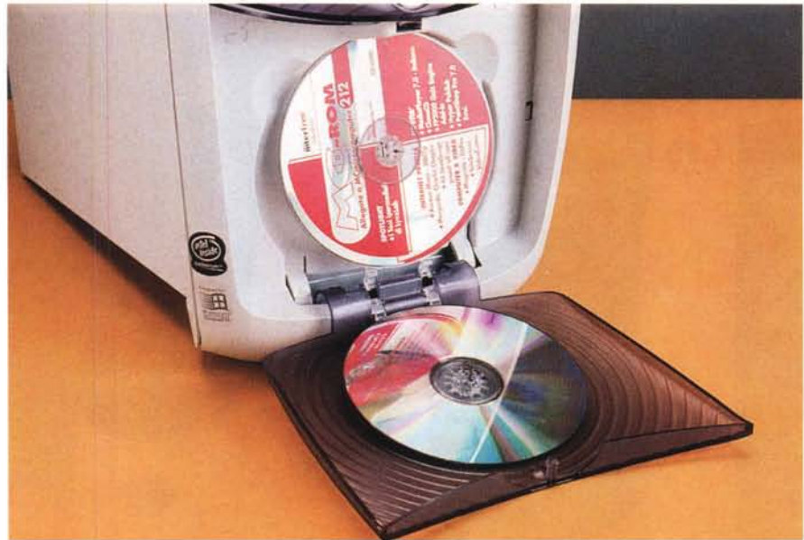
Sulla parte inferiore del frontale un pannello di plastica trasparente cela in realtà un porta CD a cinque posti, comodo per contenere i CD di uso più frequente.

Come già detto il computer è dotato di processore Celeron da 600 MHz, con