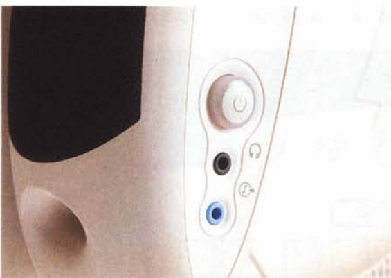
Sull'altoparlante destro sono presenti, il tasto di accensione, una presa di uscita per cuffia, che esclude gli speaker principali, e una presa di ingresso che consente di ascoltare una sorgente ausiliaria

Nei nuovissimi Compaq Presario, oltre alla dotazione di software preinstallato che include Windows Millennium