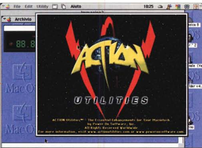
Lo splashscreen di Action Utilities.

una partita (ah, vetta somma dell'abbruttimento umano) di tennis con le paddle. Insomma c'è di che vedere!