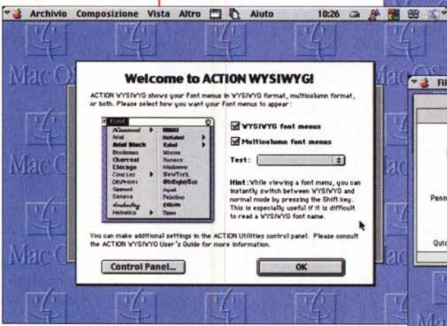
I vari ambienti d'uso, con un help immediato e di facile consultazione.

Poi, qualche mese fa, una pubblicità di sfuggita su WWW mi fece capitare sott'occhio il nome di PowerOn, che ripresentava