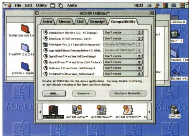
Le utility in azione; per chi conosceva e aveva adottato le Now, un piacevole salto indietro nel passato, aggiornato alle nuove esigenze e con una interfaccia più articolata e meglio strutturata.