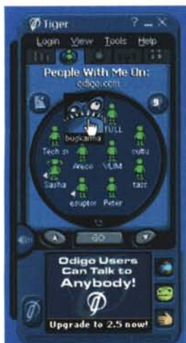
Odigo, uno degli Instant Messenger più interessanti del momento.

AWave Studio 7.0. Il più celebrato tra i me-