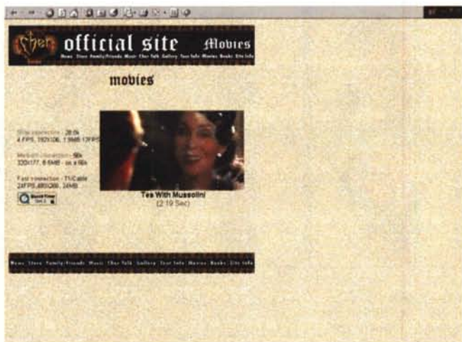
Cher, oltre che una grande cantante, non ce lo dimentichiamo, è anche un premio Oscar! Ecco la filmografia...