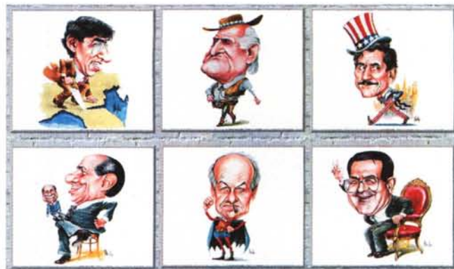
Museo della Satira: un museo per ridere, un museo virtuale. Una collezione di Javatoons a sfondo politico.