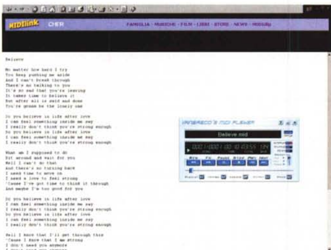
Click sulla voce MIDiClip ed eccoci sulla pagina delle "sorprese": i file MIDI di "Believe" e "Dove è l'amore", nonché il testo di "Believe" e il generatore WinOKE per costruirci da noi il file "karaoke"!