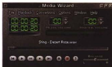
Media Wizard: il comodo ed essenziale remote del tool.

Di click in click potrete così trovare la biografia della Star, la discoteca, la filmografia (con in primo piano l'ultima apparizione in "Un tè con Mussolini"), i