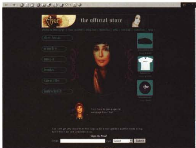
La pagina del magazzino. Qui c'è proprio di tutto!