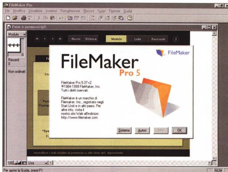
Lo splashscreen di FM5 Unlimited.

ScriptMaker, il linguaggio macro di FMPro. Peccato non sia ancora accessibile anche attraverso un vero e proprio codice sorgente.