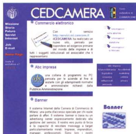
Un sito particolarmente utile per le aziende è quello della Camera di Commercio della Provincia di Milano.

Una novità nella composizione di quest'anno è la nutrita presenza di aziende di dimensioni medie, quali integratori di sistemi o rivenditori ad elevato valore aggiunto, che puntano molto sull'adozione nella pubblica amministrazione italiana di tecnolo-