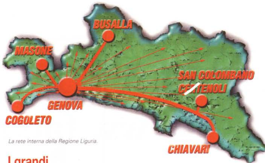
La rete interna della Regione Liguria.

sto i siti premiati e quelli segnalati saranno ampiamente promossi sulla stampa, sul Web e attraverso un CD multimediale; il sito del Forum PA riporterà inoltre la lista completa dei link.