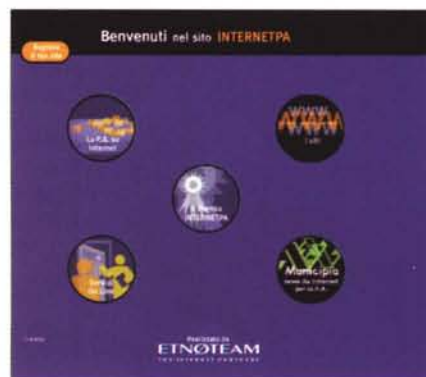
Tutte le informazioni relative al premio Internet PA sono disponibili online all'indirizzo... http://www.internetpa.it

Gli studenti delle ultime classi degli Istituti superiori di Roma e provincia sono stati invitati a compilare un elenco dei dieci servizi ritenuti di maggiore importanza tra quelli forniti da Comuni, Province e Regioni, indicando brevemente perché. Tra tutte le schede erano in palio tre PC multimediale per gli studenti, mentre i loro professori riceveranno un buono acquisto libri del valore di duecentomila lire (al momento di andare in stampa non conosciamo ancora i risultati dell'iniziativa, ndr).