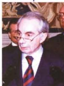
Giuliano Amato, presidente del Consiglio dei Ministri, sarà presente ai lavori insieme a buona parte dei Ministri in carica.

rietà, qualità dei servizi e il nuovo contratto di lavoro sono state le colonne portanti della settimana di lavori. Se in questa sezione l'informatica era poca, ben maggiore ne è stata la presenza tra le iniziative speciali e la sezione espositiva.