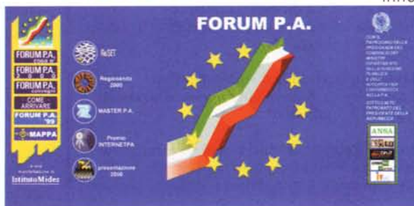
Il sito del Forum riporta tutte le informazioni sull'iniziativa.

Lo spirito dell'iniziativa non è certo quella di stabilire vincitori e vinti, bensì innestare un processo meritocratico che sia di stimolo per migliorare quanto già esiste e per aumentare il numero di realizzazioni, come d'altronde impone la stessa natura del Web, estremamente dinamica. Tra venticinque finalisti sono stati scelti cinque vincitori e cinque segnalazioni. Si tratta di un'iniziativa di Etnoteam e di Forum PA, in collaborazione con American Express, Ansa, I.net e Rai per premiare i migliori servizi on line sui siti Internet della Pubblica Amministrazione centrale e