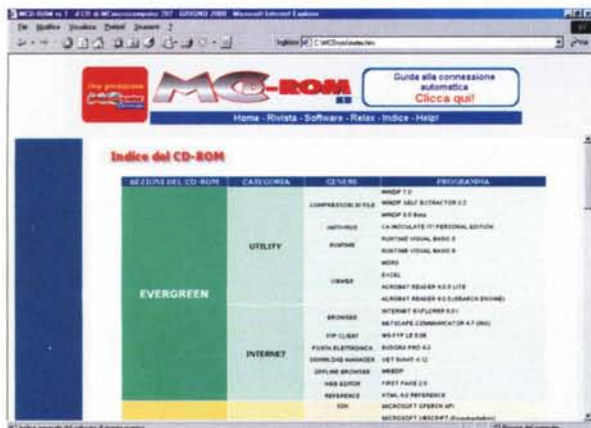
L'indice dettagliato di tutto il software contenuto sul CD-ROM.