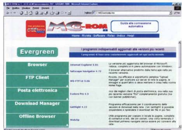
L'elenco principale del "software di base".