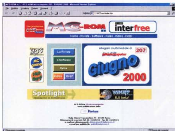
L'Home Page in HTML di MCD-ROM.

Due delle rubriche della rivista, Computer & Video e Internet Pratica, possiamo già dire che avranno presenza stabile. In effetti per come sono organizzate anche sul cartaceo - panoramiche software, file MIDI, clip audiovisivi, sample, progetti, ecc.- trovano naturale completamento sul CD. Il risultato è che i download segnalati di applicativi e applicazioni saranno immediati, gli esempi e i sample realizzati per il riscontro pratico da parte del let-