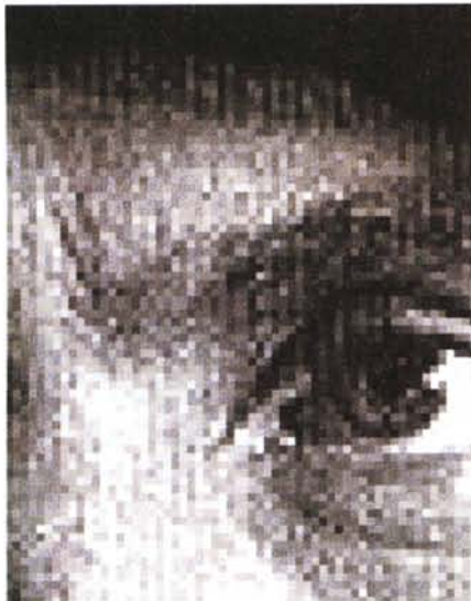
"Occhio" di Caterina Davinio.

tor, il testo appare solo occasionalmente decifrabile.