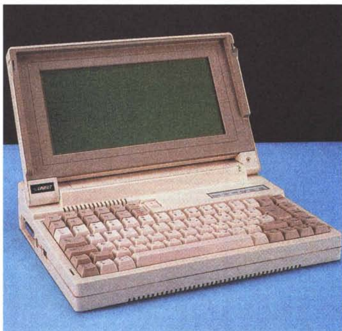
Arrivano, finalmente, i primi portatili senza unità floppy disk, antesignani giganti di tutti i subnotebook arrivati effettivamente sul mercato moltissimi anni dopo. Nella foto l'Unibit PCbit V30.

E arriviamo allo scanner, pardon allo scanner manuale Logitech Scanman. Li ricordate? Si trattava di periferiche delle dimensioni di un grosso rasoio elettrico che, tenute in una mano, venivano fatte scorrere sul testo o sulla figura da copiare e, se si era di mano ferma e regolari come orologi nella "strisciatura", i risultati erano passabili. Prezzo, compreso il software di fotoritocco, un milioncino in formato bundle; più o meno come una decina di scanner piani, di accettabile qualità, di oggi. E MC gli dedica anche sette pagine zeppe di prova.