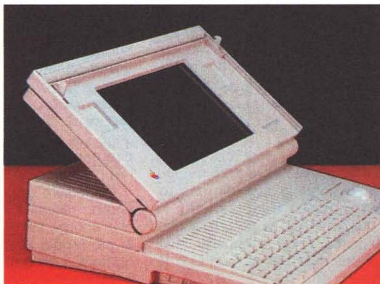
Quando la Apple decise di fare un portatile lo ha fatto "alla grande". Per le dimensioni, stile portaerei, e per il prezzo di vendita. Perfettamente allineato con le altre "mele proibite".

Permettetemi di sprecare due dei titoli di quest'articolo per i miei amati Macintosh. Ma ne vale la pena! Mac diviene, per