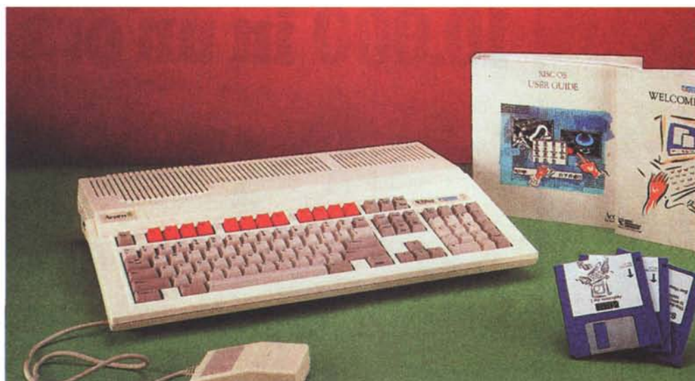
Sembra un Amiga ma, almeno per certi versi, è molto di più. Si tratta dell'Archimedes A3000, una macchina che come gli altri componenti della potentissima famiglia Acorn ha avuto poca fortuna in Italia. Peccato...

E purtroppo occorre che chiuda anche stavolta, anche se ci sarebbero due o tre cosette ancora da raccontare. A proposito, un lettore mi ha chiesto perché non racconto più, a piè di discorso, qualche curiosità. Il fatto è che, ormai, è da un pezzo finita l'era pionieristica e, così come in quella dell'epopea del West, sono spariti i personaggi pittoreschi e le storie narrate accanto al fuoco. Tempi moderni!