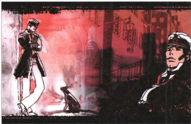
Anna nella jungla