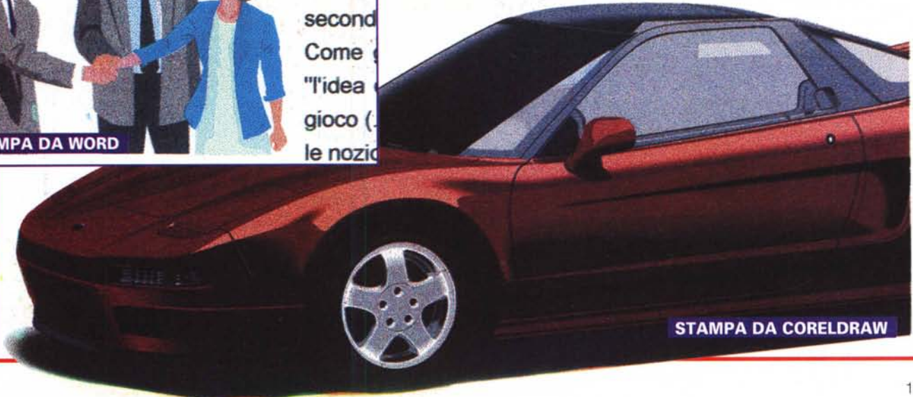
STAMPA DA CORELDRAW

fotom elabor tridimen second Come "l'idea gioco (l le nozi