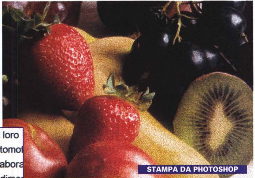
STAMPA DA PHOTOSHOP