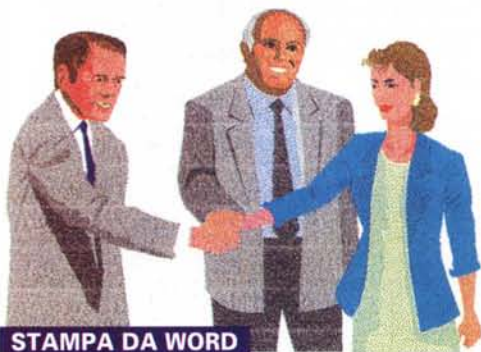
STAMPA DA WORD

fotom elabor tridime second Come "l'idea gioco (l le nozi