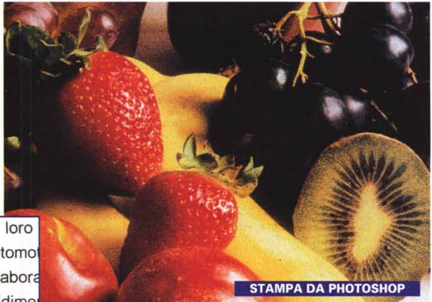
STAMPA DA PHOTOSHOP