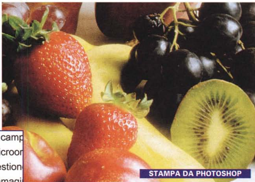
STAMPA DA PHOTOSHOP

immagini digitali nei loro rispettivi camp