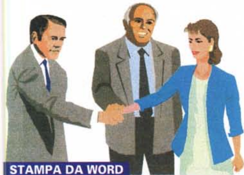
STAMPA DA WORD

immagini digitali nei loro rispettivi camp