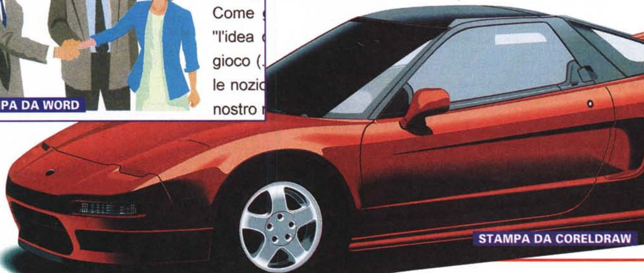
STAMPA DA CORELDRAW

microor gestio immagi Come "l'idea gioco le nozi nostro