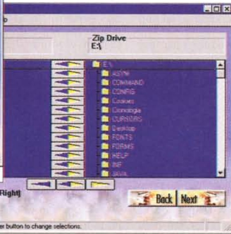
Queste schermate di Double ZIP illustrano adeguatamente la semplicità d'interfaccia e, di conseguenza, d'uso del programma.