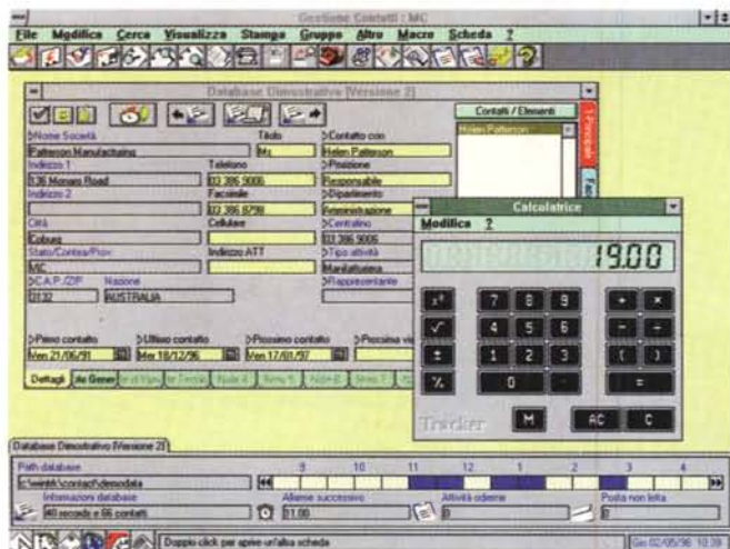
La schermata principale per la Gestione Contatti e la calcolatrice.

na, aprire la sua scheda, vedere in che occasione ci siamo sentiti l'ultima volta e fissare un appuntamento, l'invio di un documento via fax o una spedizione dal magazzino dopo aver verificato tramite l'archivio «magazzino» la presenza della merce. Se questa azione coinvolge altri utenti della rete (ad esempio l'ufficio spedizioni) questi saranno automaticamente allertati attraverso i servizi di posta interna di Traker 2.