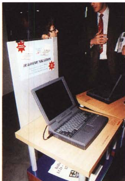
Questi due computer portatili stavano colloquiando tramite la porta IrDa ad una velocità fantasmagorica... 4 Mbit/s

La Barco, nota per i suoi proiettori, sta affiancando alla sua linea tradizionale basata su proiezione tramite tubi, una basata su cristalli liquidi. In fiera era in mostra il BARCODATA 2100, basato appunto sulla tecnologia LCD, capace di proiettare un'immagine di 6 metri di base. La risoluzione naturalmente è di 1.024 x 768 pixel.