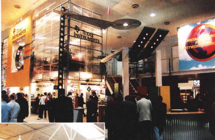
La grandezza degli stand come al solito era titanica più che teutonica.