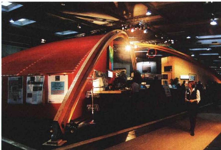
Lo spazio dell'Hewlett Packard era stato addirittura asfaltato.

Motorola, che già nel 1989 ha dato il via alla rivoluzione delle comunicazioni