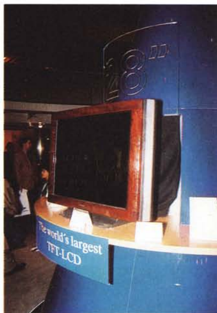
Ci potete anche non credere ma questo è un display TFT-LCD da ben 28". Il più grande e più sottile del mondo (soli 5 cm).