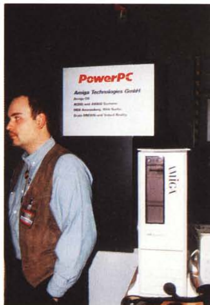
Il nuovo Amiga basato su PowerPC, ancora qualche interrogativo sul nome: la sigla PC non incontra il favore del marketing.

La gamma dell'elaborazione in viaggio era ben rappresentata. Toshiba aveva in mostra due nuovi notebook basati su Intel Pentium a 133 MHz. Si tratta del Tecra 710CDT e 720CDT. Entrambi montano un display LCD da 12.1" e sul