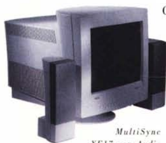
MultiSync XE17 con Audio Tower Speaker System opzionale. Ideale per utilizzi multimediali.

Da NEC, un nuovo standard di riferimento per i monitor: i MultiSync X, una nuova gamma capace di fornirvi tutte le funzioni più avanzate e innovative.