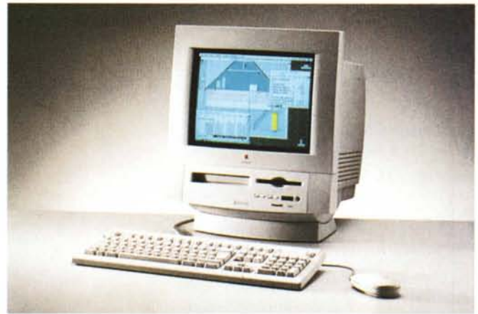
Grazie al processore PowerPC 603 il nuovo 5200, pur essendo una macchina entry level (o quasi...) offre una grande potenza d'elaborazione.

terattivi o software didattico oppure, usando il sistema Apple TV/Video (standard in alcune configurazioni), guardare la televisione o persino elaborare video propri. I nuovi Macintosh Performa consentono inoltre l'utilizzo dei cosiddetti «Enhanced CD», normali CD audio che comprendono parti multimediali e possono essere usati sia su comuni lettori stereo sia su unità CD-ROM collegate al computer. È infine possibile collegare facilmente un qualunque modem esterno per Macintosh e, con l'apposito software, collegarsi in Internet o con altri servizi telematici, oppure inviare e ricevere fax.