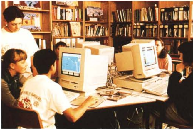
A detta della stessa Apple, il Performa 5200 è il personal computer multimediale ideale.