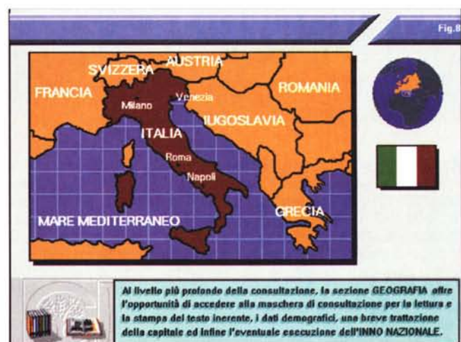
Al livello più profondo della consultazione, la sezione GEOGRAFIA offre l'opportunità di accedere alla maschera di consultazione per la lettura e la stampa del testo inerente, i dati demografici, una breve trattazione della capitale ed infine l'eventuale esecuzione dell'INNO NAZIONALE.