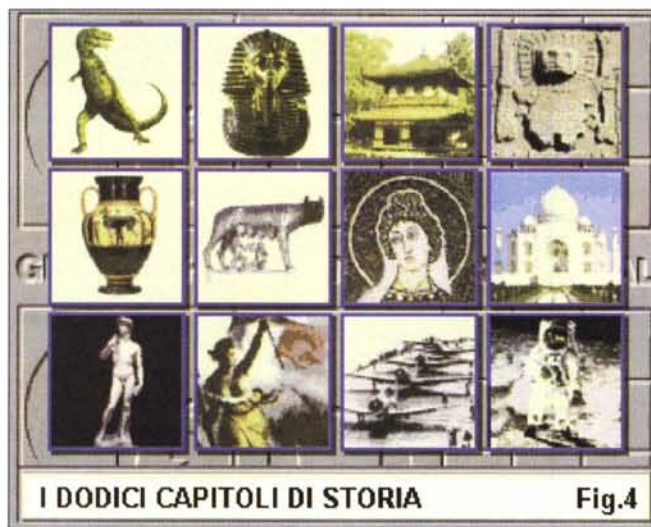
Figura 4 - Abbiamo scelto la sezione di Storia e ci portiamo all'interno del ramo dedicato, nel quale potremo scegliere fra i dodici capitoli raffigurati. Dalla preistoria ai nostri giorni.

Infine, selezionando l'icona dei «volumi» ci si porta nella maschera di lettura sulla quale scorrerà l'intero elenco dei lemmi relativi al capitolo. Ed ora una nota curiosa: per quanto riguarda il capi-