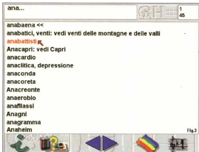
Figura 3 - Maschera di lettura dei Lemmi. Tale livello è raggiungibile da tutte le sezioni del cosiddetto «Albero della Conoscenza» di figura 1.

per avanzare o retrocedere sulle pagine ed infine l'icona «colori» e quella «suoni». La prima indicherà il numero delle immagini (se presenti) e, tramite il segno «#», la presenza o meno di un'animazione o di un film. La seconda (se completata dalla sovrapposizione di un numero) indicherà a sua volta la possibilità di accedere all'esecuzione di una sequenza audio. È questa, contenendo tutti i contributi mediali disponibili, la parte più spettacolare dell'intera opera.