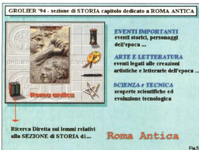
Figura 5 - Sempre dalla sezione di Storia, abbiamo scelto di indirizzare la ricerca nel periodo di Roma Antica. Per questo, come per gli altri undici capitoli storici, il pannello di consultazione ci consente di porre tre condizioni di ricerca: Eventi Importanti, Arte e Letteratura, Scienza e Tecnica.