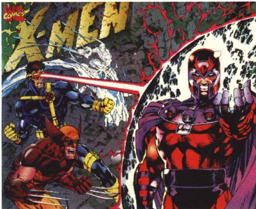
Un'immagine BMP tratta dal "bonus" presente in Designer Fonts per Windows.