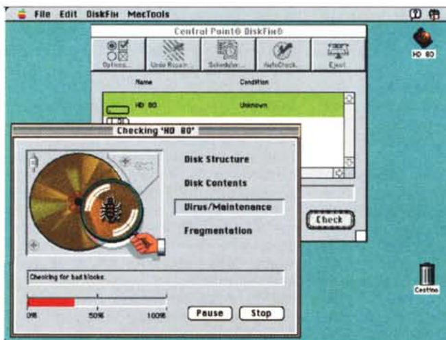
La simpatica schermata della ricerca Virus.

L'unica cosa che garantisce la sicurezza dei dati è una corretta programmazione delle copie di Back-up. Per la prima volta ho trovato degli schemi di Back-up che spiegano come metter su un sistema garantito. Capita spesso ad esempio che gli utenti facciano il back-up sempre