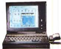
TravelMate 4000 WinSX o WinDX * 486SX-25 Mhz o 486DX-25 Mhz * 4 Mb Ram * 120 Mb HD o 200 Mb HD * 2,5 Kg * TravelPoint