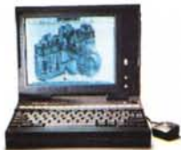
TravelMate WinSLC * TI486SLC-25 Mhz * 2 Mb - 60 Mb HD * 4 Mb - 80 Mb HD * 2,5 Kg * TravelPoint

Per saperne di più, rivolgetevi ai rivenditori qualificati Texas Instruments o contattateci allo 039/63221 - Fax 039/652206