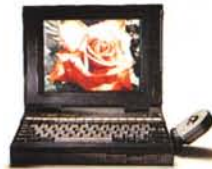
TravelMate 4000 WinSX o WinDX2 Colore * 486 SX-25 Mhz o 486 DX2-40 Mhz * 4 Mb Ram o 8 Mb Ram * 120 Mb HD o 200 Mb HD * 2,8 Kg * Microsoft BallPoint