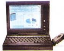
TravelMate 4000 WinDX2 * 486DX2-50 Mhz * 8 Mb Ram * 200 Mb HD * 2,5 Kg * Microsoft BallPoint