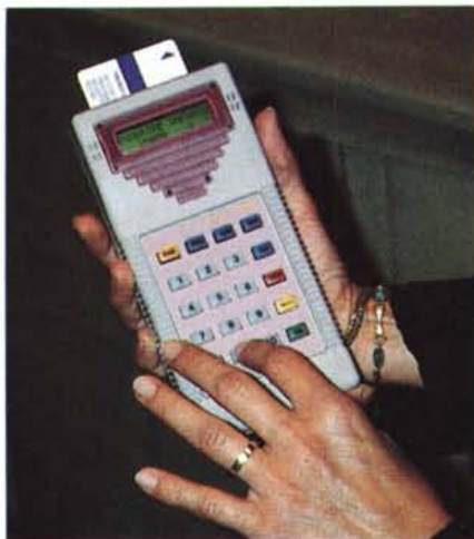
Il terminale portatile Moneybox e la C-LESS fanno parte del sistema STRESA, che comprende sistemi di gestione, terminali POS e ATM e così via, messo a punto da Olivetti per tutti gli impieghi delle carte magnetiche.

Per sfruttare al massimo questa possibilità, Olivetti ha messo a punto un terminale portatile, alimentato a batterie ricaricabili, che può essere usato anche dove non è di-