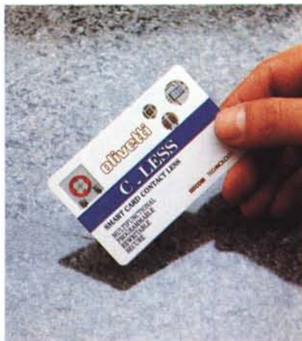
La carta Olivetti C-LESS, prodotta da Olivetti Sixcom su tecnologia AT&T, ha le stesse dimensioni di una normale carta di credito, ma contiene un microprocessore e memorie ROM e RAM. L'accoppiamento con il terminale avviene senza contatti, soggetti a sporcarsi e consumarsi, grazie a sensori induttivi e capacitivi.

sponibile il collegamento con un computer, come appunto su un autoveicolo, in un'edicola o in altre situazioni difficili.