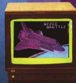
CD 251 (20'')

La scheda viene fornita completa di cavo per il collegamento a monitor e di software che consente sia di dimostrare il funzionamento della Spectrogram che di creare un programma in BASIC contenente i colori selezionati.