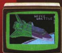
CS 66 (26'')