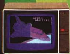
CS 2234 (22'')