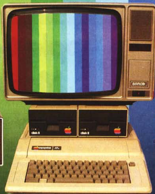
CS 1634 (16'')