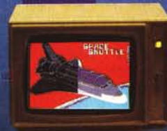
CD 233 (16'')